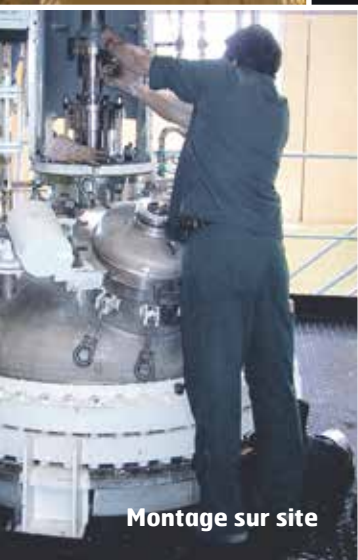
Montage sur site