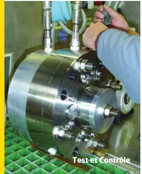
Test et Contrôle