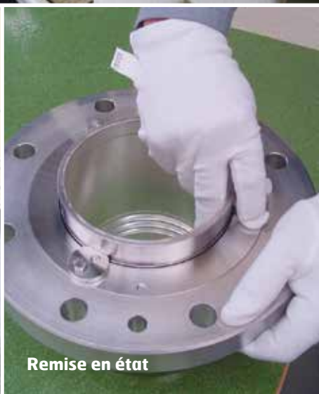
Remise en état